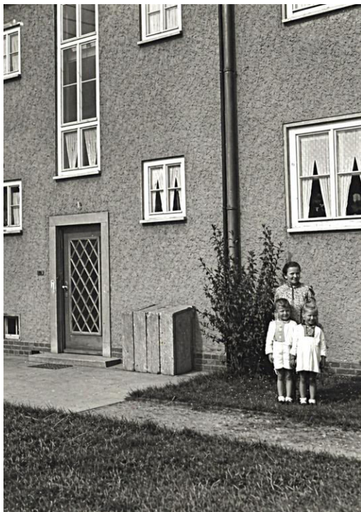
Hauseingang Böhlen Streitteich 5

Am 21. April 1945 kamen wieder Bomber, die Sirenen heulten und wir wollten in Richtung Tagebau, in die Stollen. An jenem Tag wurden wir auf dem Weg dahin von Luftschutzhelfern nicht weiter gelassen, da die Flieger schon so nah waren, wir mussten in den Bunker in der Ortsmitte, der noch 1995 stand, als ich mit den Aufzeichnungen begann.