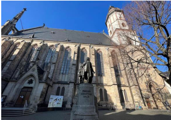
Diesen Blick auf das Bachdenkmahl hatte ich

Ich ging nach der 8. Klasse, mit 13 Jahren, in die Lehre. Ich lernte 3 Jahre Damenmaßschneiderin