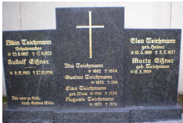
Grabstein in Pegau