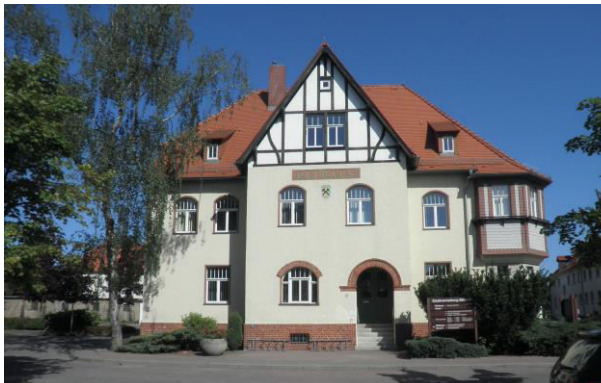
Rathaus Böhlen 2014 – links stand das Schloss

Französische Gefangene mussten bei den Aufräumarbeiten helfen. So zogen wir vom Streitteich 5 in die Joseph-Haydn-Straße 16. Ein Neubau, der noch nicht fertig war. Unsere Dachwohnung im zweiten Stock wurde notdürftig möbliert. Die Badewanne war aus Beton gegossen mit kleinen Steinchen und geschliffen (ähnlich den Gehwegplatten). In diesem Haus wohnten sechs Familien, davon vier Flüchtlinge. In den letzten Kriegstagen wurde Zwenkau verteidigt, ein Dachstuhl im Haus hinter uns wurde getroffen. Wir waren froh nicht schon wieder ohne Heim dazustehen.