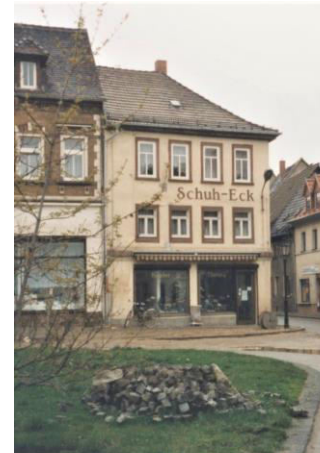
Pegau 1997 - Schuhgeschäft