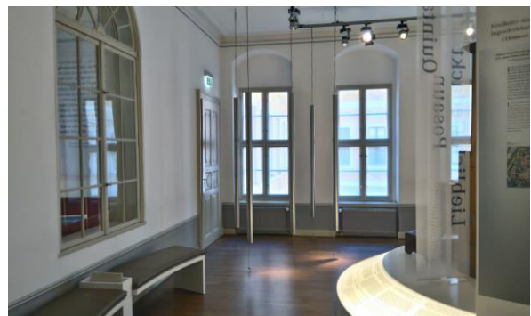
Vor diesen beiden Fenstern war der Arbeitstisch in der Schneiderei

Als ich 80 Jahre alt war und Leipzig wieder mal besuchte, ging ich in das Bach-Museum gegenüber der Thomaskirche. Es waren im 1. Stock die Räume der ehemaligen Schneiderwerksatt. Ich setzte mich in die Ausstellungsräume und träumte mich in diese Kindheit zurück.