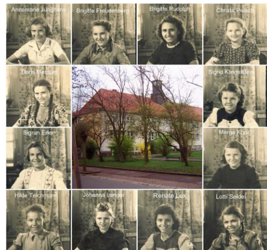
Mädchen in der 7ten Klasse in Böhlen - 1951

Vater bekam als Arbeiter des Braunkohlenwerkes 100 Zentner Deputat-Kohle pro Jahr.