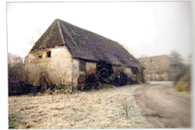
Stallgebäude im Hof