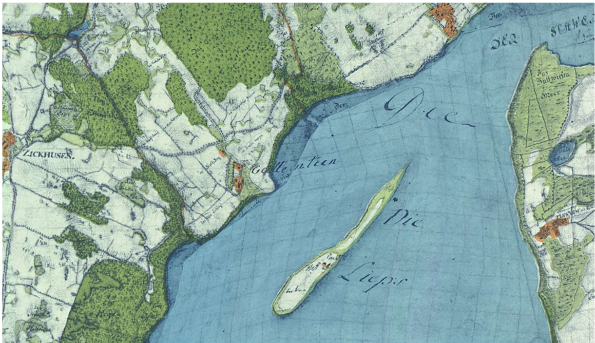
Gallentin und seine Umgebung in der Wiebeking'schen Kartierung von 1786

Das Gut wurde verpachtet und die Einkünfte flossen dem Landesherrn zu.