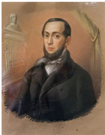
Porträt des John Brinckman Ludwig Hückstädt Stadtmuseum Güstrow.