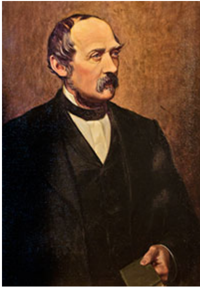
John Brinckman (1814 - 1870)

Revolution von 1848/49 bewies der Lehrer und Vater von insgesamt zehn Kindern mit seinen antifeudalen "Neuen Mecklenburgischen Liedern" Entschlossenheit und Mut.